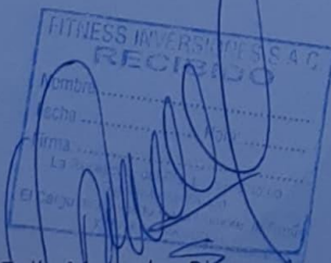
Zoila Mazuelos Rivas